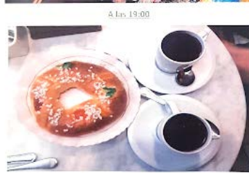
CHOCOLATE con ROSCON DE REYES